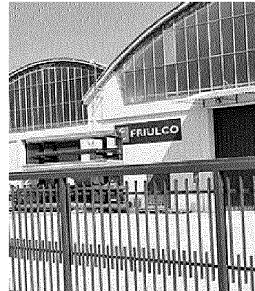
La sede della Friulco a Povoletto

Friulco completano perfettamente la gamma di Fluitek Orsenigo Valves e presentano fortissime occasioni di sinergia con il nostro gruppo per il futuro. La condivisione di obiettivi comuni e lo sforzo di sistema messo in campo con Friulia e la Banca Popolare di Cividale ha fatto e farà la differenza nel progetto di rilancio».